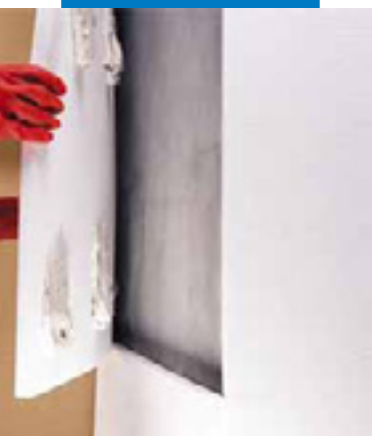
点粘法黏贴保温材料