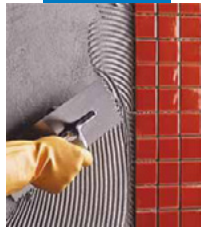
墙上安装瓷砖马赛克