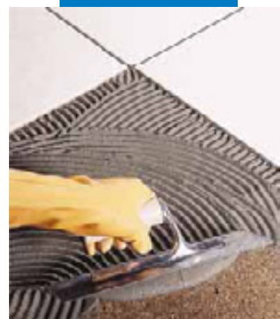
软木上贴单面烧砖