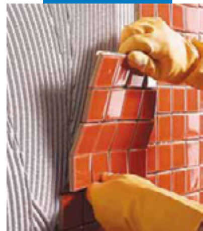
墙上安装瓷砖马赛克