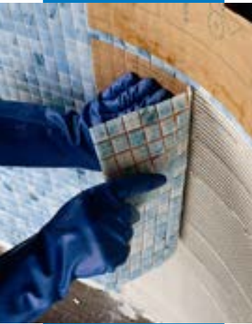
马贝锦砖胶P10与马贝乳液133混合，用于泳池内2×2cm玻璃马赛克铺设。