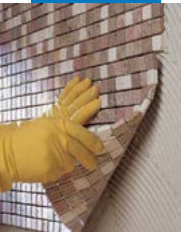
墙体安装2×2cm大理石马赛克