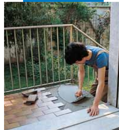
Στεγανωτική εξομάλυνση και τοποθέτηση με Kerabond + Isolastic