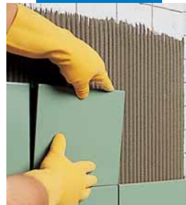
Τοποθέτηση πάνω σε παλιά πλακίδια