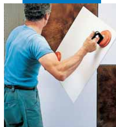
Τοποθέτηση ΚΕΡΑΙΟΝ πάνω σε τοίχο