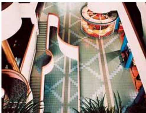
Τεχνητός γρανίτης τοποθετημένος με Kerabond T + Isolastic Civic Center - North York Ontario (Καναδάς)

Όλα τα παραδείγματα εφαρμογής των προϊόντων είναι διαθέσιμα κατόπιν ζήτησης αλλά και στην ιστοσελίδα της Μapei www.mapei.gr και www.mapei.com