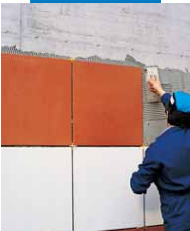
Τοποθέτηση πλακιδίων μεγάλου μεγέθους με Kerabond+Isolastic

Όλα τα υποστρώματα που θα δεχτούν τις κόλλες Kerabond ή Kerabond T , Kerafloor ή Adesilex P10+Isolastic πρέπει να είναι επίπεδα, να έχουν μηχανικές αντοχές και να είναι απαλλαγμένα από χαλαρά μέρη, γράσα, λάδια, βαφές, κερία κ.λπ. Προκατασκευασμένα στοιχεία σκυροδέματος ή χυτό σκυρόδεμα πρέπει να ωριμάσουν το λιγότερο για 3 μήνες σε καλές κλιματολογικές συνθήκες. Οι τσιμεντοειδείς επιφάνειες δεν πρέπει να υπόκεινται σε συρρίκνωση από τη στιγμή που θα τοποθετηθούν τα πλακίδια, συνεπώς σε θερμά κλίματα τα επιχρίσματα πρέπει να αφήνονται να ωριμάσουν τουλάχιστον μία εβδομάδα για κάθε cm πάχους. Τα τσιμεντοειδή κονιάματα δαπέδων πρέπει να έχουν έναν συνολικό χρόνο ωρίμανσης τουλάχιστον 28 ημερών, εκτός και αν έχουν κατασκευαστεί με ειδικά κονιάματα της ΜΑΠΕΙ όπως το Mapcem , το Mapcem Pronto , το Topcem ή Topcem Pronto . Μειώστε τη θερμοκρασία επιφανειών που είναι πολύ ζεστές λόγω της απευθείας έκθεσης τους στην ηλιακή ακτινοβολία, με διαβροχή. Τα υποστρώματα από γύψο και δάπεδα από