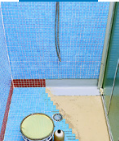
铺设马赛克在预制浴室间