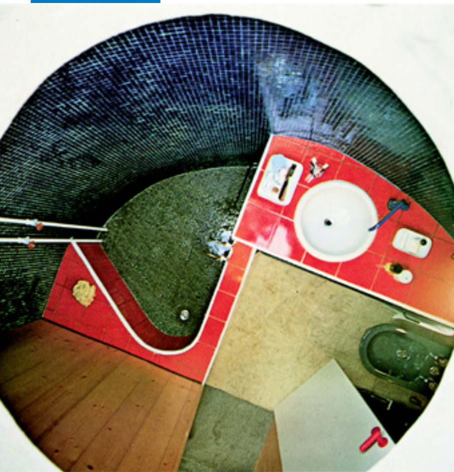
浴缸和淋浴间的防水施工